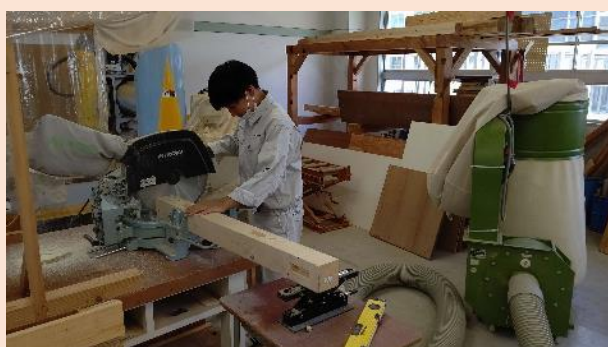
卓上丸のこ(のこ刃径 380mm)