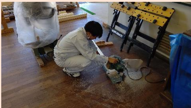
卓上丸のこ(のこ刃径 216mm)

令和4年7月29日(金)、26日(火)から始まった「花の村」の椅子製作、墨付け作業がほぼ終わり、加工作業に入りました。慣れない作業ではありますが数を熟し、徐々に加工精度が良くなってきています。仮組も行ってみました。