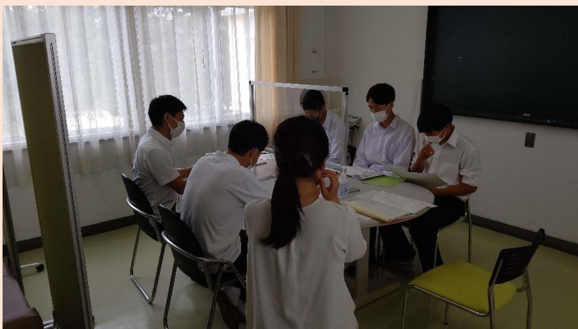
プレゼンテーションの様子

その結果、多少の改善を行い来週には実際に材料を購入し、製作することとなりました。