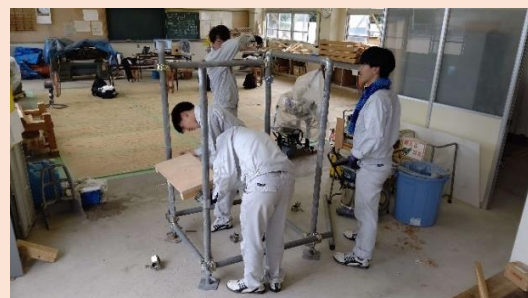
足場用単管を使用した、測定用器具を製作の様子

後日行われる、各班員が考えた椅子についてのコンセプト、製作に必要な図面、使用材料、製作に必要な費用等について、プレゼンテーションの準備を行っています。