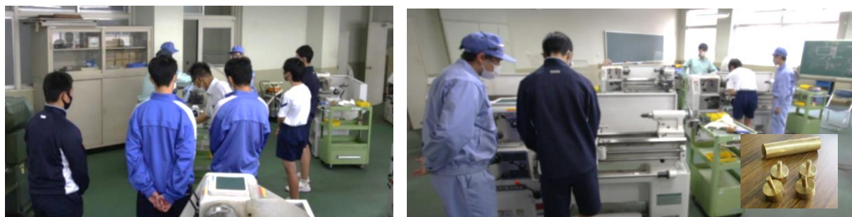
旋盤で「コマ（独楽）」を作ろう！