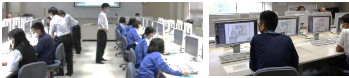
3D CADで立体図面をつくろう！

令和3年10月16日（土）に第2回オープンスクールを行い、多数の中学生や保護者の方に参加していただきました。引率していただいた中学校の先生方や保護者の皆様、ありがとうございました。