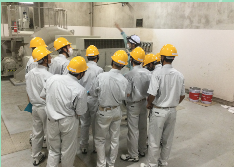
県内の建設現場を見学！

8 月 27 日、新型コロナウイルス感染症対策として、本校で初めて校長室と教室をオンラインでつないだ始業式を行いました。式では校長先生の講話を静かに聞き、その後、部活動の大会結果報告や表彰式も行いました。直接、元気な様子を見ることができず、寂しい気持ちもありますが、大掃除や課題テストに真剣に取り組む姿から 2 学期への意欲を感じることができました。2 学期は江工祭や球技大会など学校行事がたくさんあります。引き続き、新型コロナウイルス感染症対策と体調管理に努め、充実した 2 学期を送りましょう！