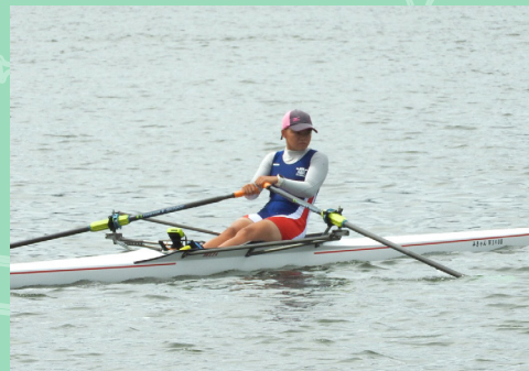
インターハイの大会結果！

も のづくり部は、毎年行われる工業系の各種競技大会参加や検定取得のため、実技練習や作品の製作に取り組んでいます。大会は機械加工、溶接、電気工事や木材加工など分かれています。年に数回、外部から講師を招いて講習会を行ったり、他校と合同練習などをして技術を磨くこともあります。競技大会では、島根・鳥取県代表として中国大会に出場しています。ものづくりに興味があり、さらに自分の技能・技術を高めたい人はぜひ、入部してみてください！