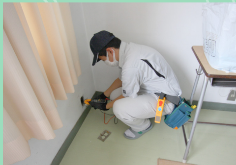
課題研究「電ボラ 52 班」

9 月 5 日、ロボット競技島根県大会が松江市で開催され、県内の工業系の高校 4 校 5 チームでロボット技術を競い合いました。競技はコース上に設定された課題を達成する技術や時間を競って行われますが、思うような操作ができず同率 4 位という悔しい結果になりました。昨年までは 3 年生が参加していましたが、今年度からもづくり部 1・2 年生の初心者チームで参加しました。思うような結果は得られませんが、大会の緊張感などを感じることができました。この経験を活かして次年度に向けて頑張ります！