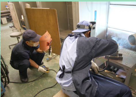
部活動紹介！『ものづくり部』

も のづくり部は、毎年行われる工業系の各種競技大会参加や検定取得のため、実技練習や作品の製作に取り組んでいます。大会は機械加工、溶接、電気工事や木材加工など分かれています。年に数回、外部から講師を招いて講習会を行ったり、他校と合同練習などをして技術を磨くこともあります。競技大会では、島根・鳥取県代表として中国大会に出場しています。ものづくりに興味があり、さらに自分の技能・技術を高めたい人はぜひ、入部してみてください！