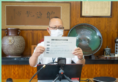
初のオンライン始業式！

8 月 27 日、新型コロナウイルス感染症対策として、本校で初めて校長室と教室をオンラインでつないだ始業式を行いました。式では校長先生の講話を静かに聞き、その後、部活動の大会結果報告や表彰式も行いました。直接、元気な様子を見ることができず、寂しい気持ちもありますが、大掃除や課題テストに真剣に取り組む姿から 2 学期への意欲を感じることができました。2 学期は江工祭や球技大会など学校行事がたくさんあります。引き続き、新型コロナウイルス感染症対策と体調管理に努め、充実した 2 学期を送りましょう！