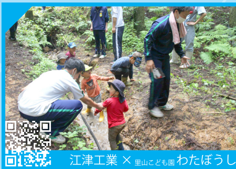
江津工業 × 里山こども園 わたぼうし

3 年生は1・2年時に学んだ知識や技術を活かし、自ら課題設定し、解決していく「課題研究」という授業があります。今年度、AEは7班、MRは6班が魅力的な取り組みを行っています。「ときわり印刷リノベーション」は江津本町にある空き物件で、生徒が実践的な学習の場として数年前から実施しています。現在、「間仕切り壁」と「天井」の造作は建築コース、配線は電気コースが行い、コースを超えた協働を行っています。たくさんの生徒が関わった建物が地域の拠点となる施設に生まれ変わる予定です。完成を楽しみにしていきましょう！