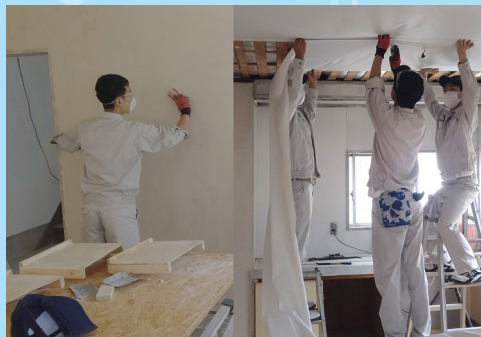
課題研究で「ときわりノベ」

3 年生は1・2年時に学んだ知識や技術を活かし、自ら課題設定し、解決していく「課題研究」という授業があります。今年度、AEは7班、MRは6班が魅力的な取り組みを行っています。「ときわり印刷リノベーション」は江津本町にある空き物件で、生徒が実践的な学習の場として数年前から実施しています。現在、「間仕切り壁」と「天井」の造作は建築コース、配線は電気コースが行い、コースを超えた協働を行っています。たくさんの生徒が関わった建物が地域の拠点となる施設に生まれ変わる予定です。完成を楽しみにしていきましょう！