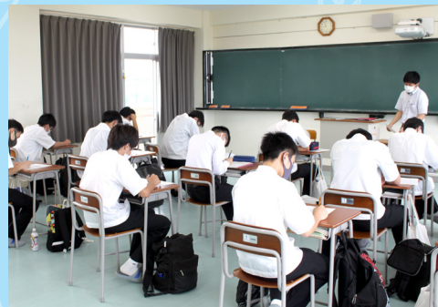
NIE 活動を実施しています！

里 山子ども園「わたぼうし」の協力のもと、家庭総合で3年生が保育体験実習を行いました。実習前に乳幼児の特徴などを学習し、親しみやすいように特製の名札を作って参加しました。昨年製作したツリーハウスと近くの川で活動し、暑さに負けず元気に遊ぶ園児の皆さんにパワーをもらいながら楽しい時間を過ごし、たくさんの笑顔が見られました。わたぼうしは「コウギョウを見に行こう」にも参加してもらい、工業高校の魅力やおもしろさを感じてもらっています。今後もいろいろな形で関わり合えることを楽しみにしています。