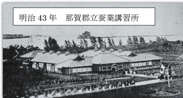
明治 43 年 那賀郡立蚕業講習所

その後、昭和 9 年に改修後、木造校舎となり、昭和 37 年から昭和 51 年に RC 造（鉄筋コンクリート）に改修されました。平成 27 年に長期耐震構造補強工事を行い、現在に至ります。