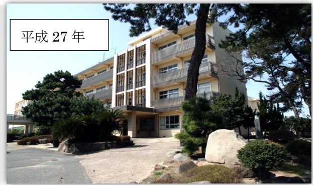
平成 27 年