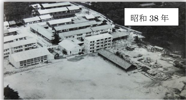
昭和 38 年