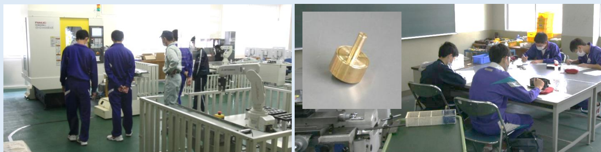
旋盤で「コマ（独楽）」を作ろう！