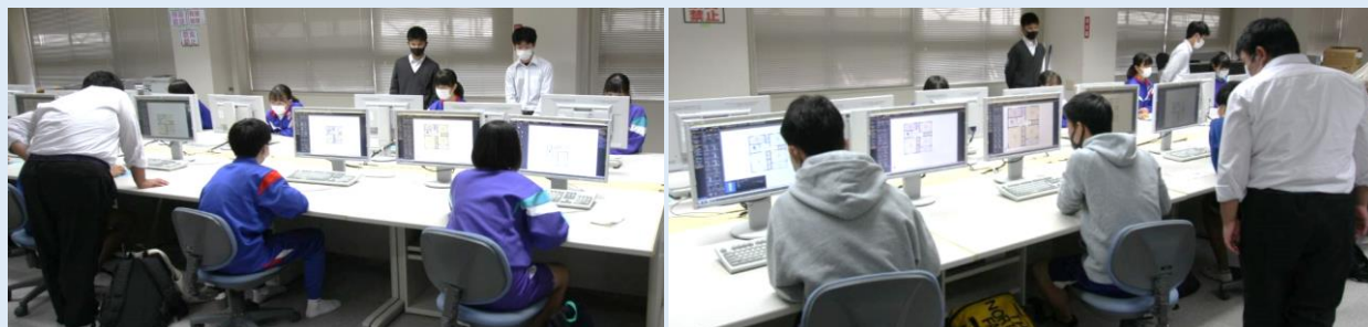
3D CADで立体図面をつくろう！

令和2年10月17日（土）に第2回オープンスクールを行い、多数の中学生や保護者の方に参加していただきました。引率していただいた中学校の先生方や保護者の皆様、ありがとうございました。