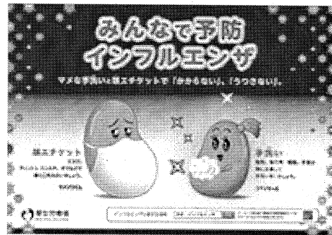
厚生労働省 インフルエンザポスター