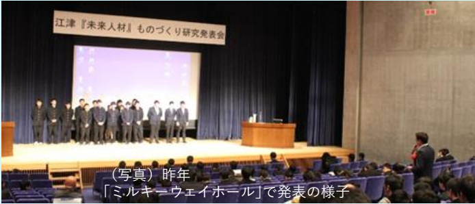
(写真) 昨年 「ミルキーウェイホール」で発表の様子

令和2年1月31日(金)13時から、「パレットごうつ」において本校とポリテクカレッジ島根と合同で江津「未来人材」ものづくり研究発表会を開催します。本校とポリテクカレッジから各3つの研究発表と中学校を代表して、桜江中学校から発表を行います。また、生徒と学生の研究発表の際には、地元企業の皆様から講評をいただきます。3年生の皆さんには、本研究で学んだことや感じたことを生かしながらさらに研鑽をつまね、社会に貢献出来る人材になって欲しいと思います。保護者並びに地域の皆様もぜひ見学に来てください。お待ちしております。